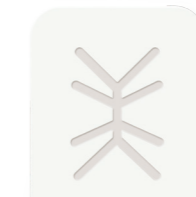
Posterior Large 24x30mm