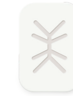
Posterior Single 17x25mm