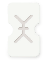
Anterior Single 14x24mm