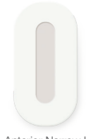
Anterior Narrow L 12x24mm